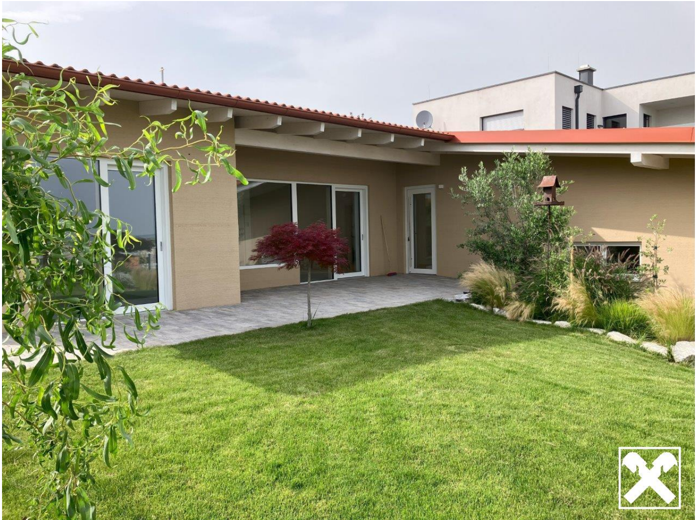
Garten mit Terrasse