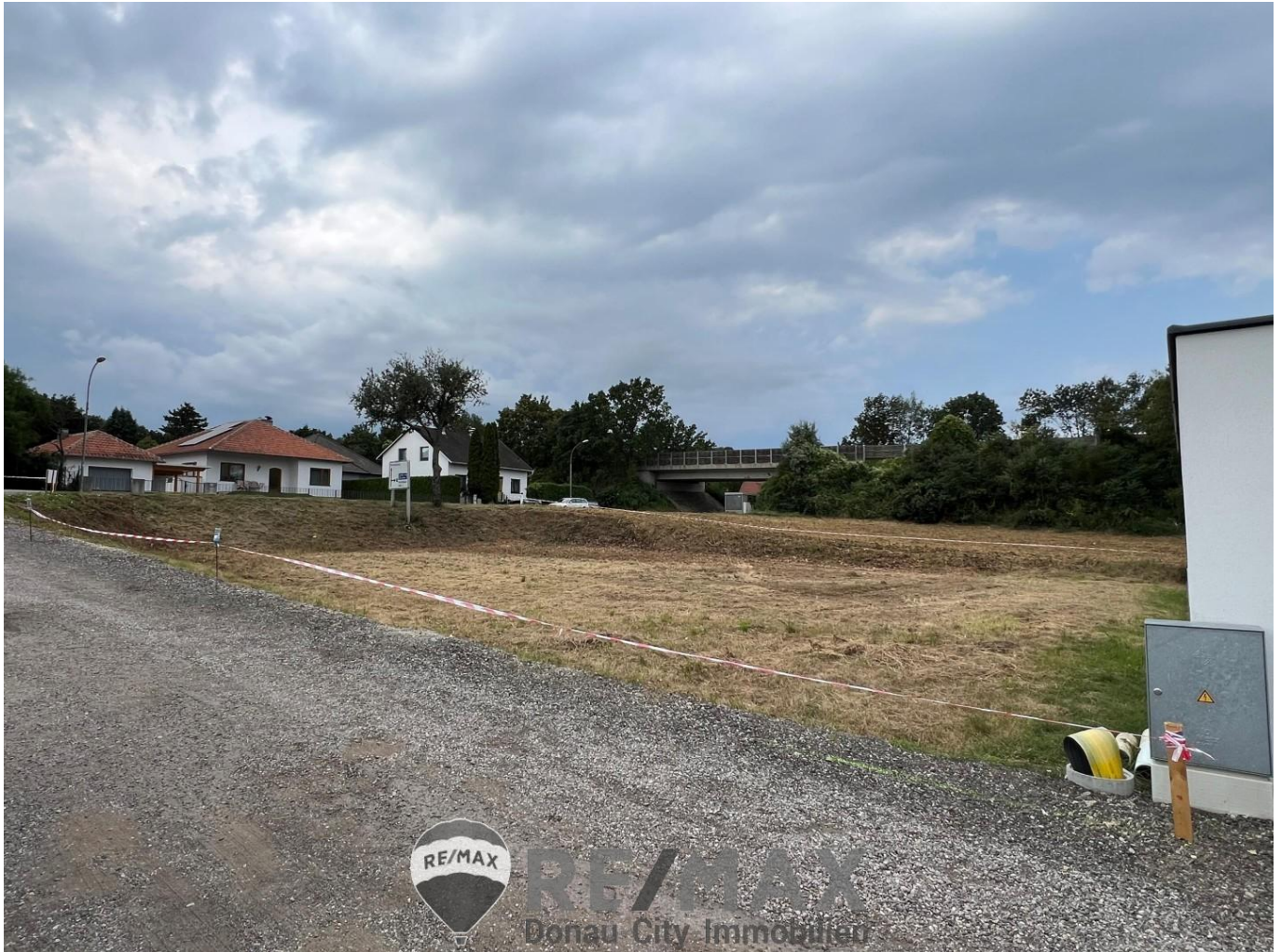
01 Baugrundstück in Judenau