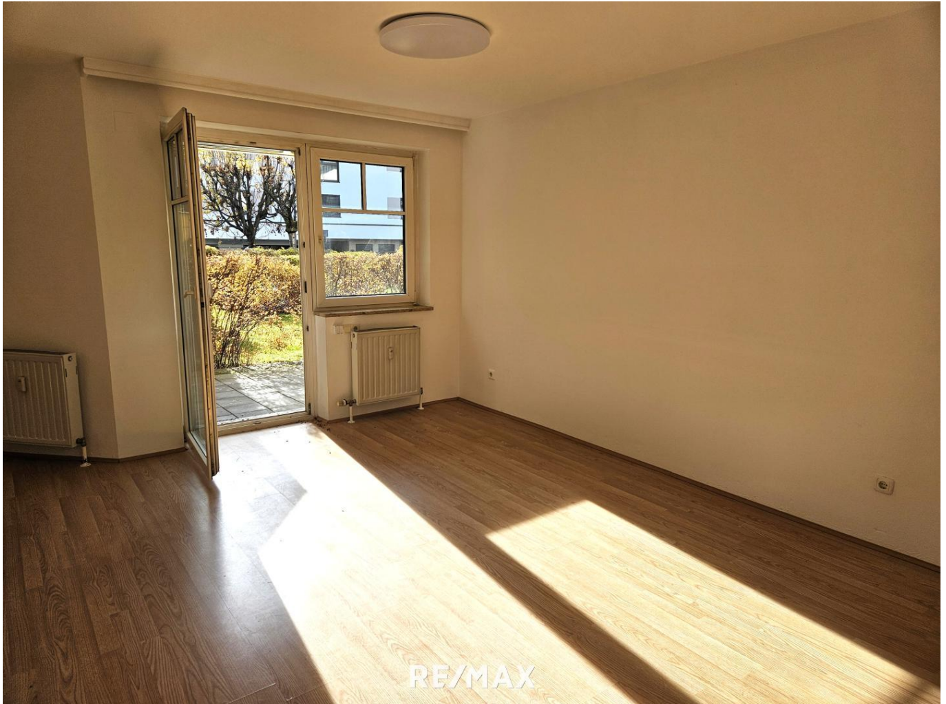
Wohnzimmer / living room