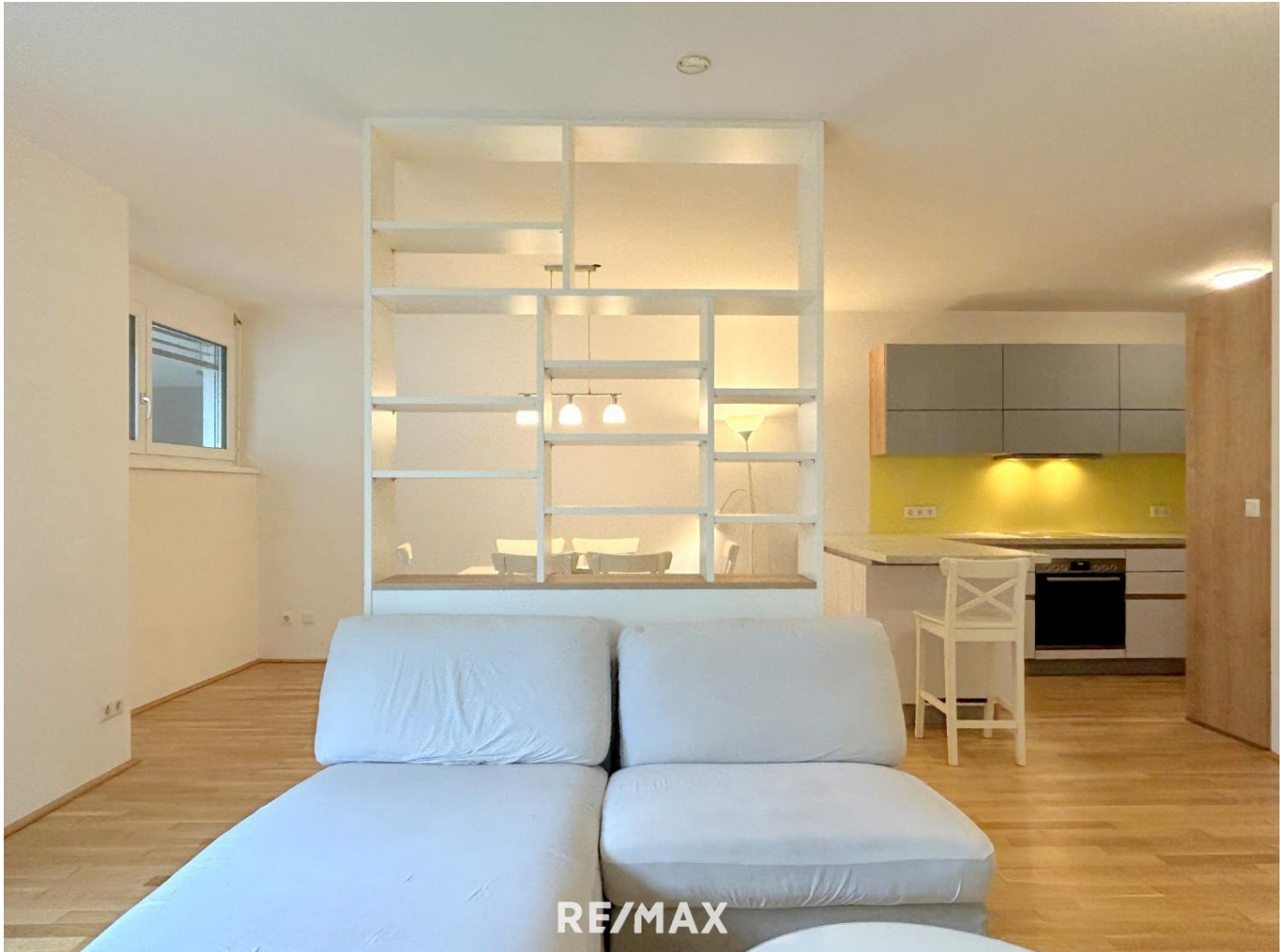
Wohnzimmer mit Raumteiler