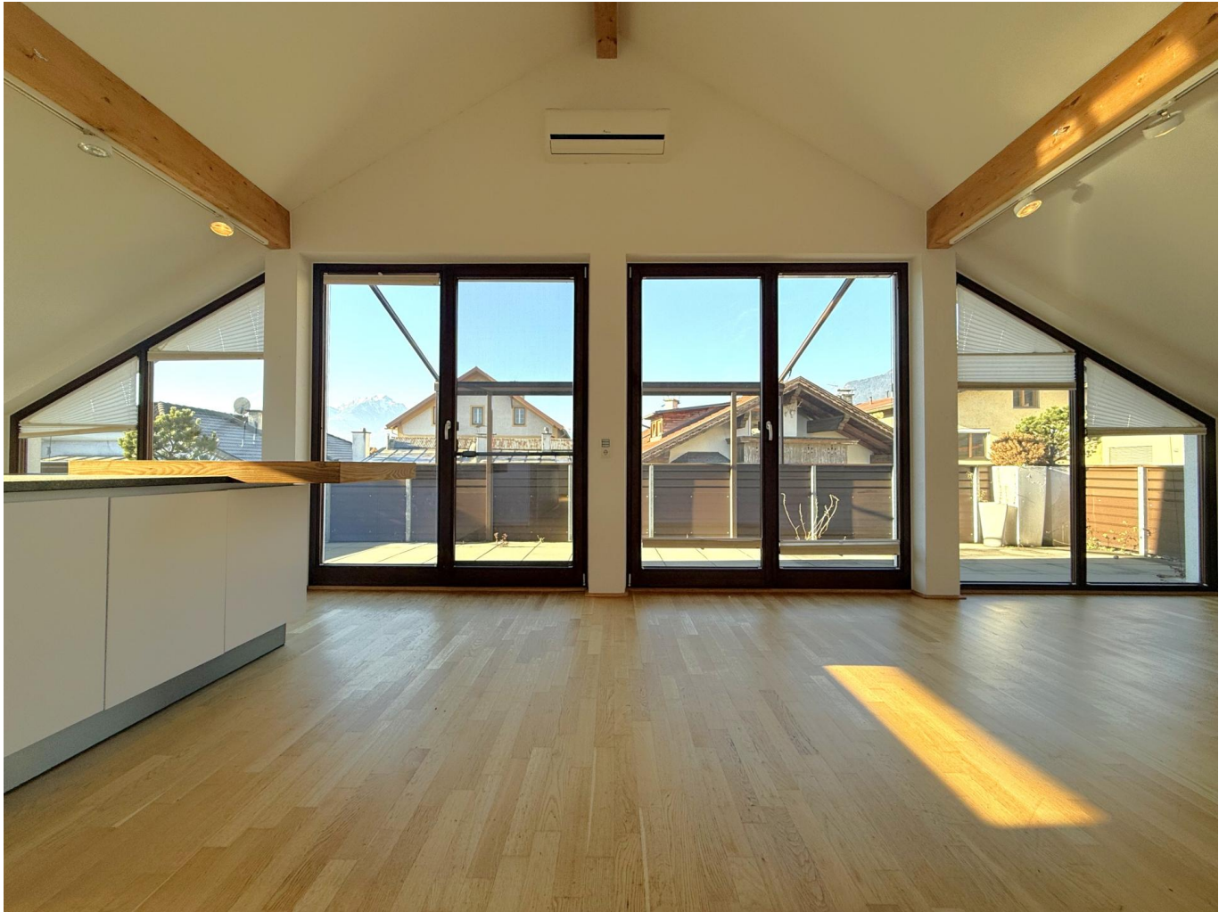
Wohnzimmer / Küche