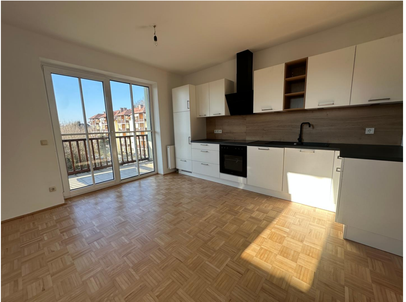
Wohnzimmer mit offener neuer Küche