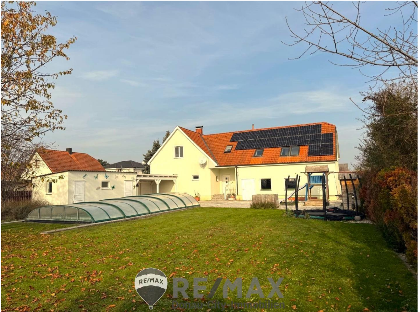
1. Hauptfoto, Haus, Garten