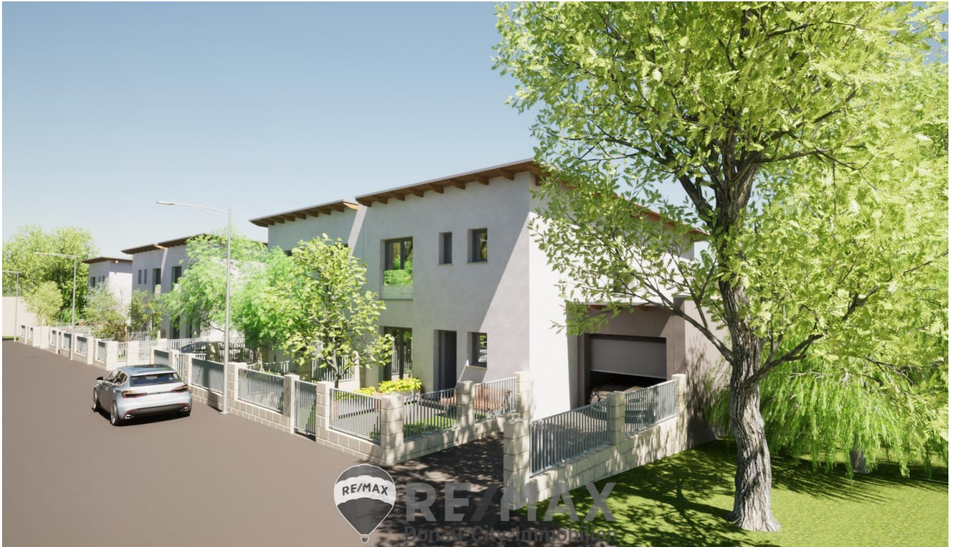
Bild Straßenseite, Symbolfoto