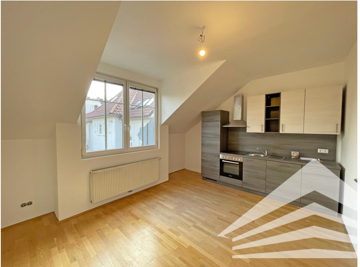
Küche inkl. Essbereich