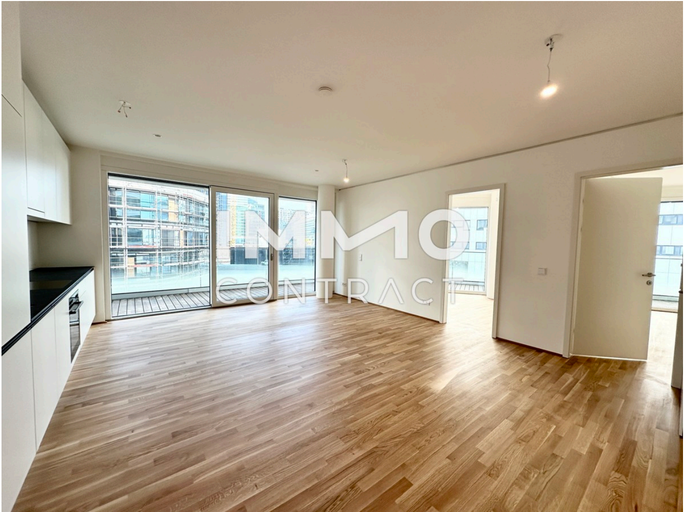
View 3 2