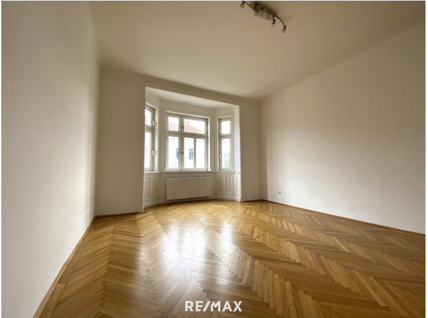
Wohnzimmer mit Erker