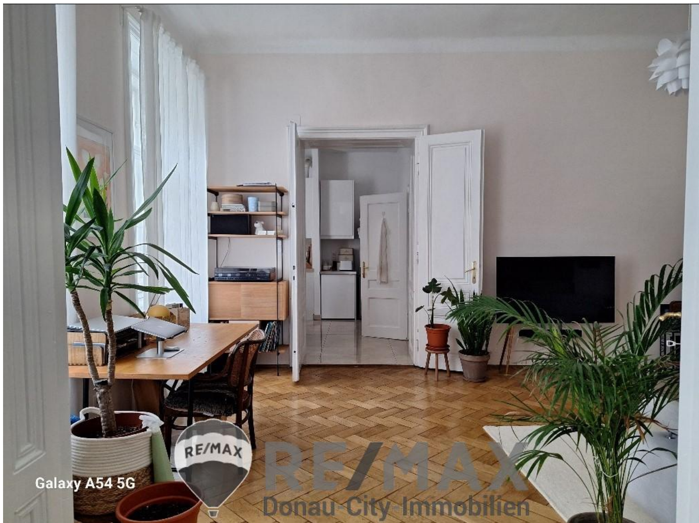
Galaxy A54 5G