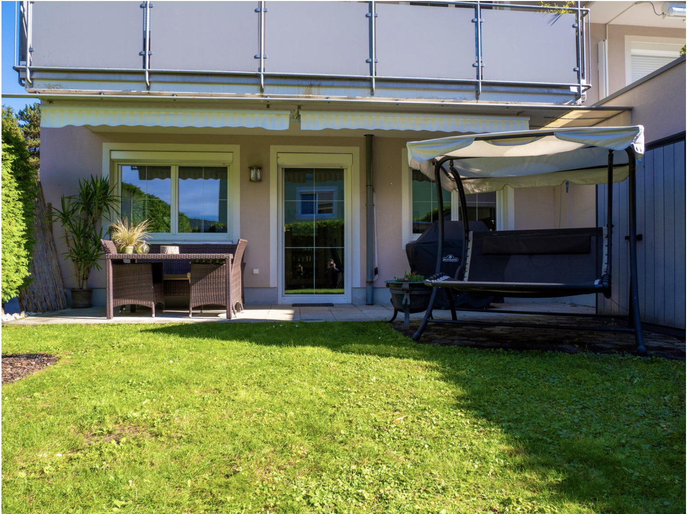
Garten / Außenansicht