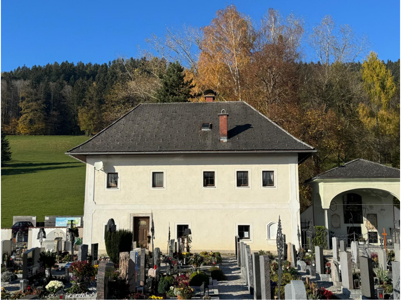
Haus an der Friedhofsmauer