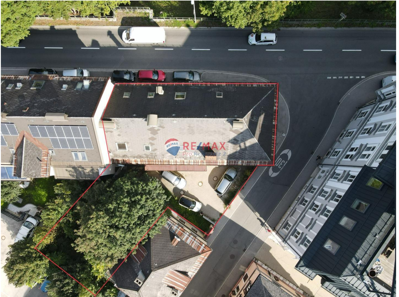
Ansicht von oben