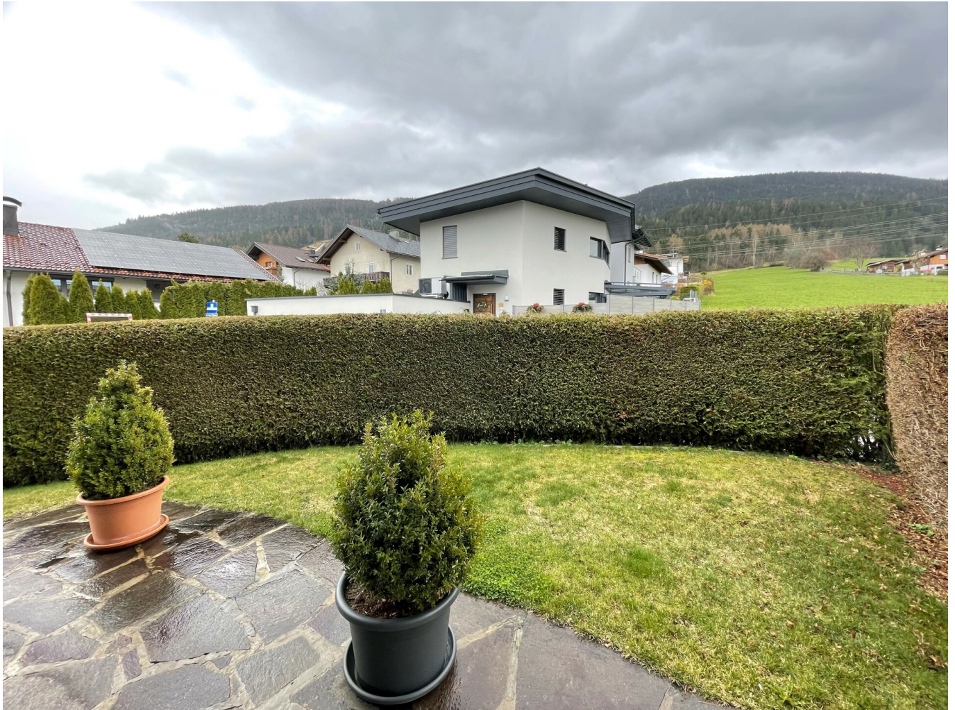
Top 3 OST:Garten