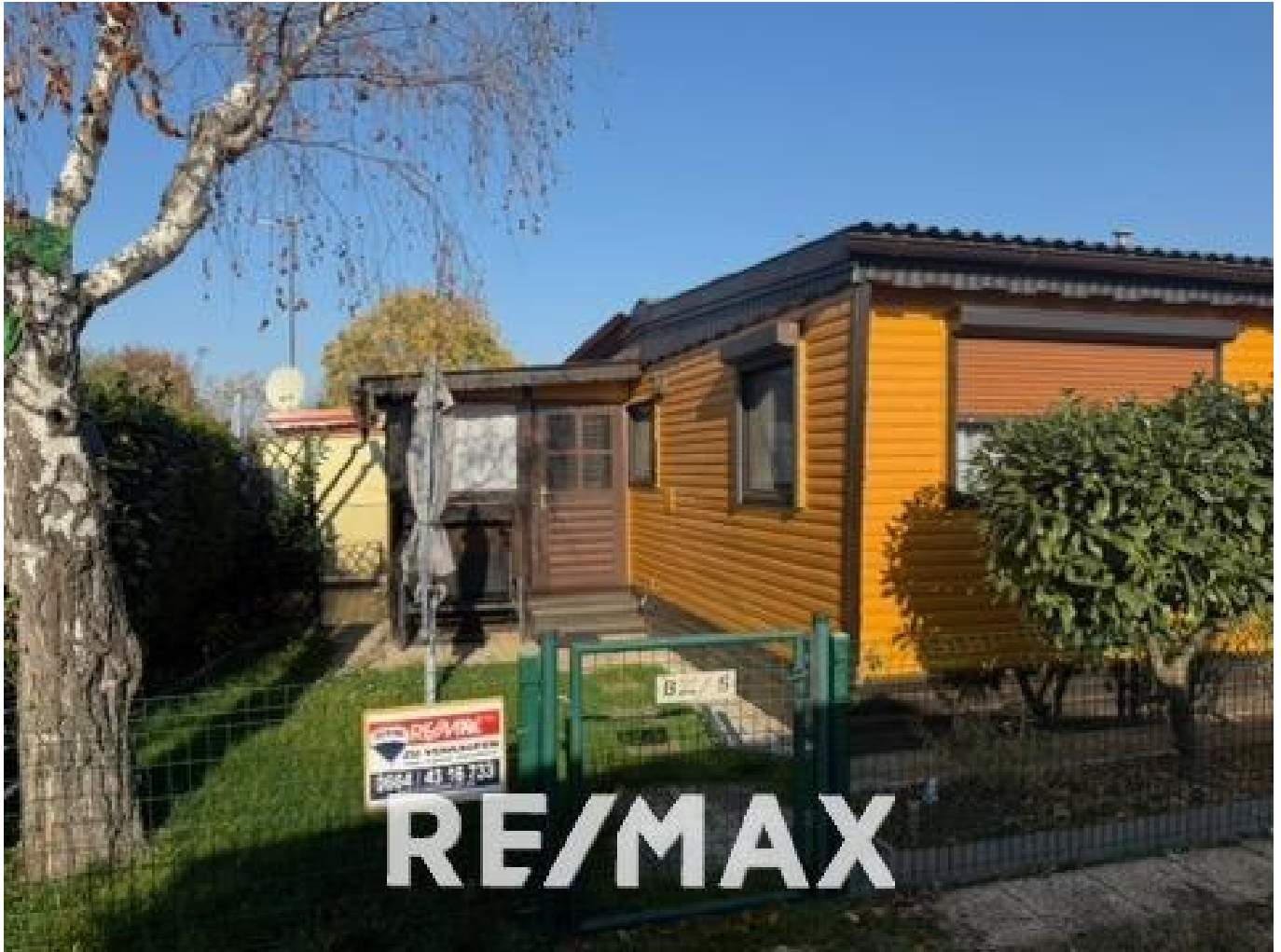
Ansicht vom Weg