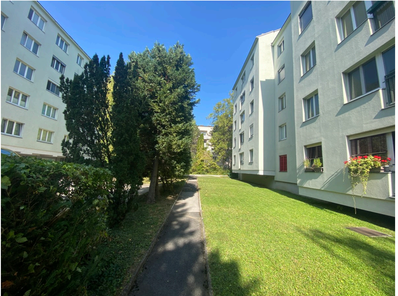
Gemeinschaftsgarten mit Sitzgelegenheit