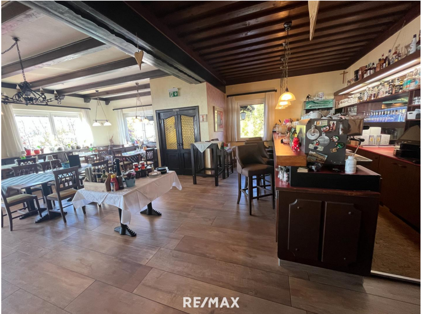
Gasthaus - Gastzimmer mit Theke