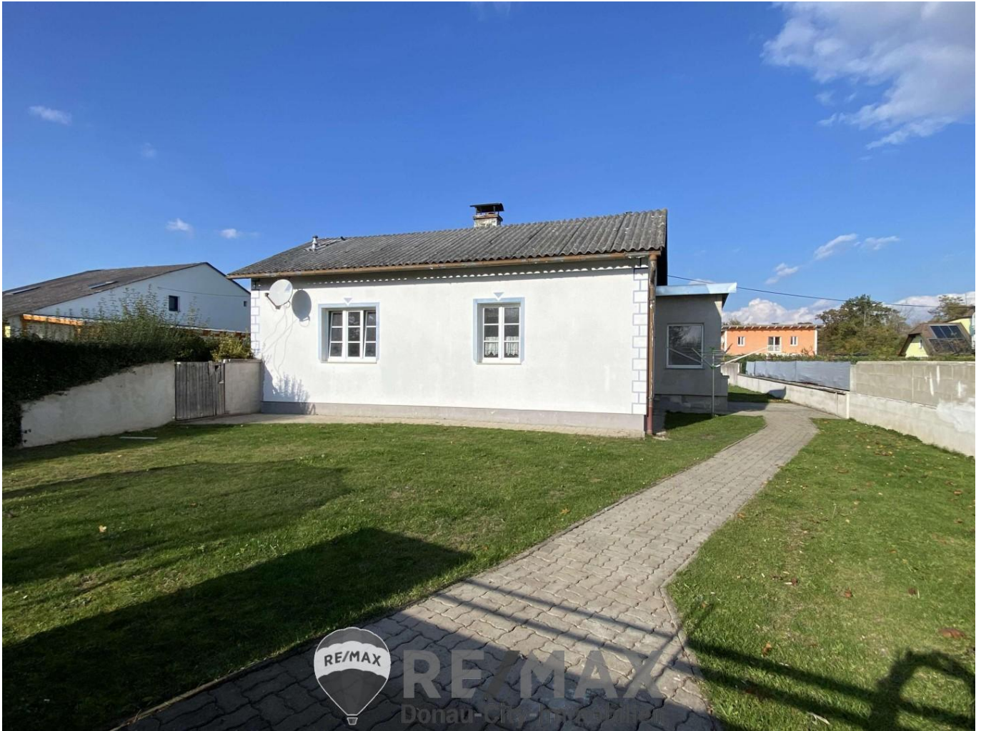
01. Ansicht Vorgarten