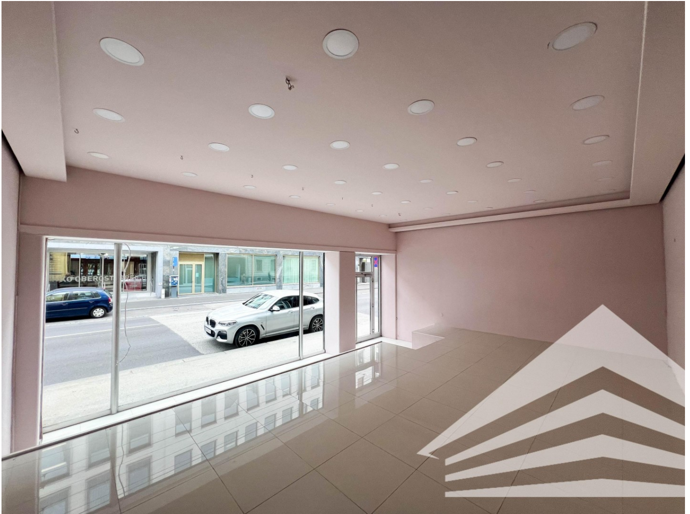
Shopfläche rechts Mozartstrasse