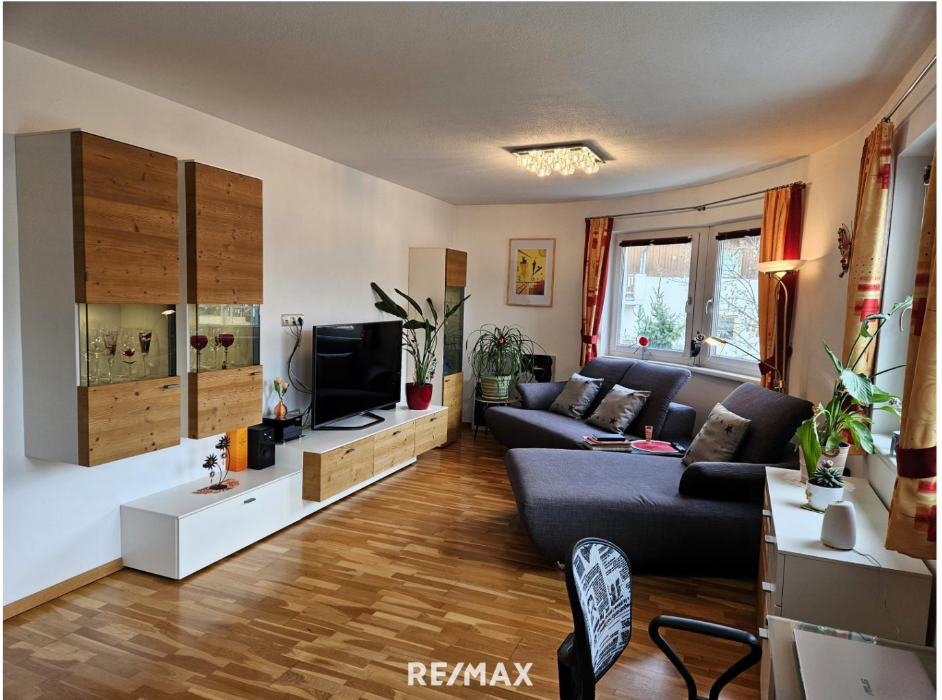
Wohnzimmer / living room