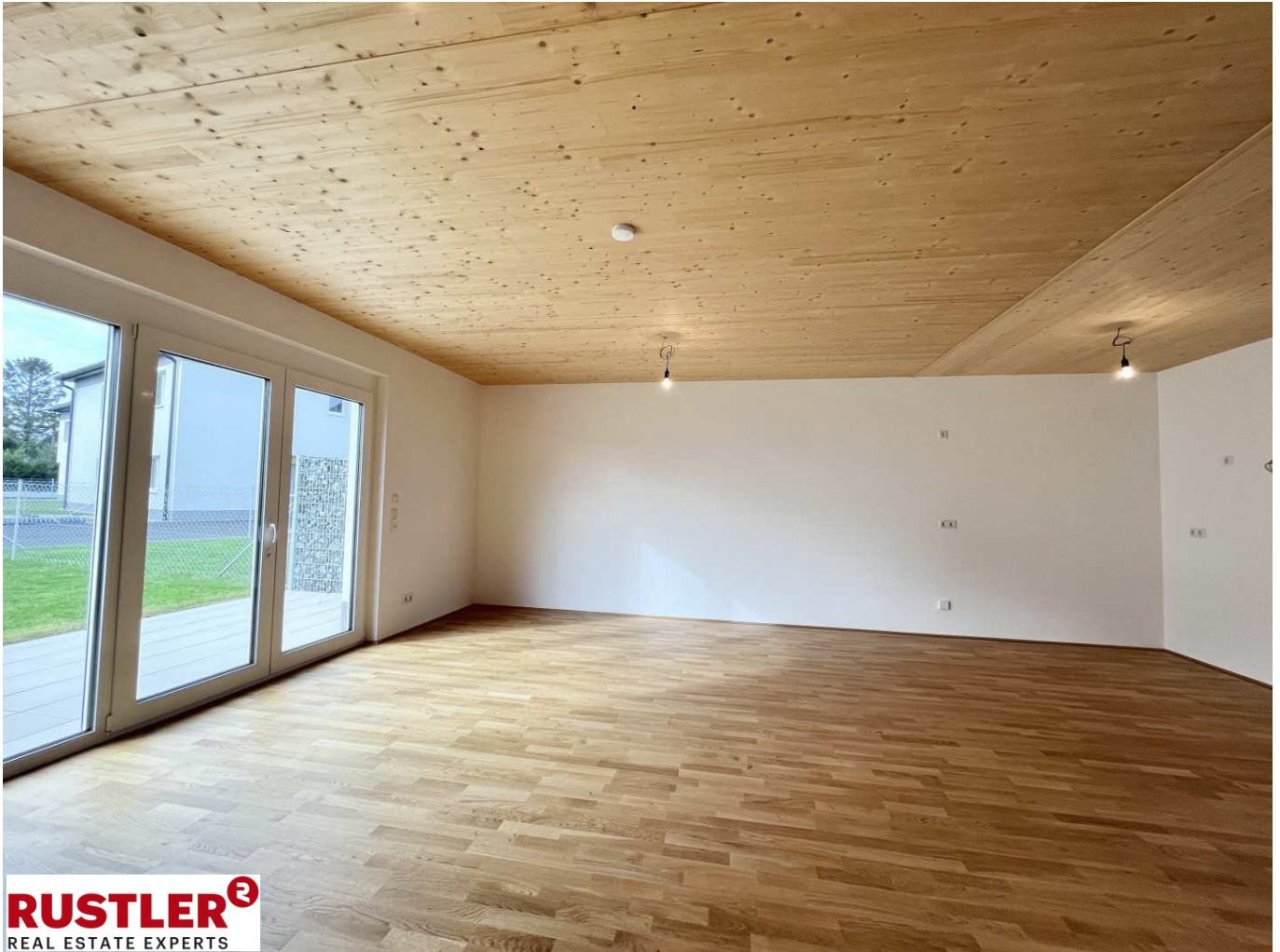
Wohnzimmer mit Ausga