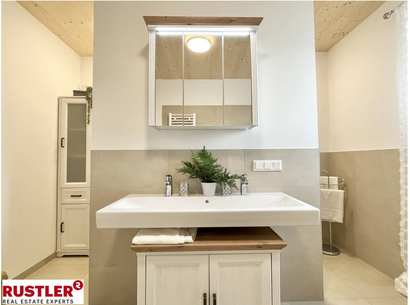
Bad A II