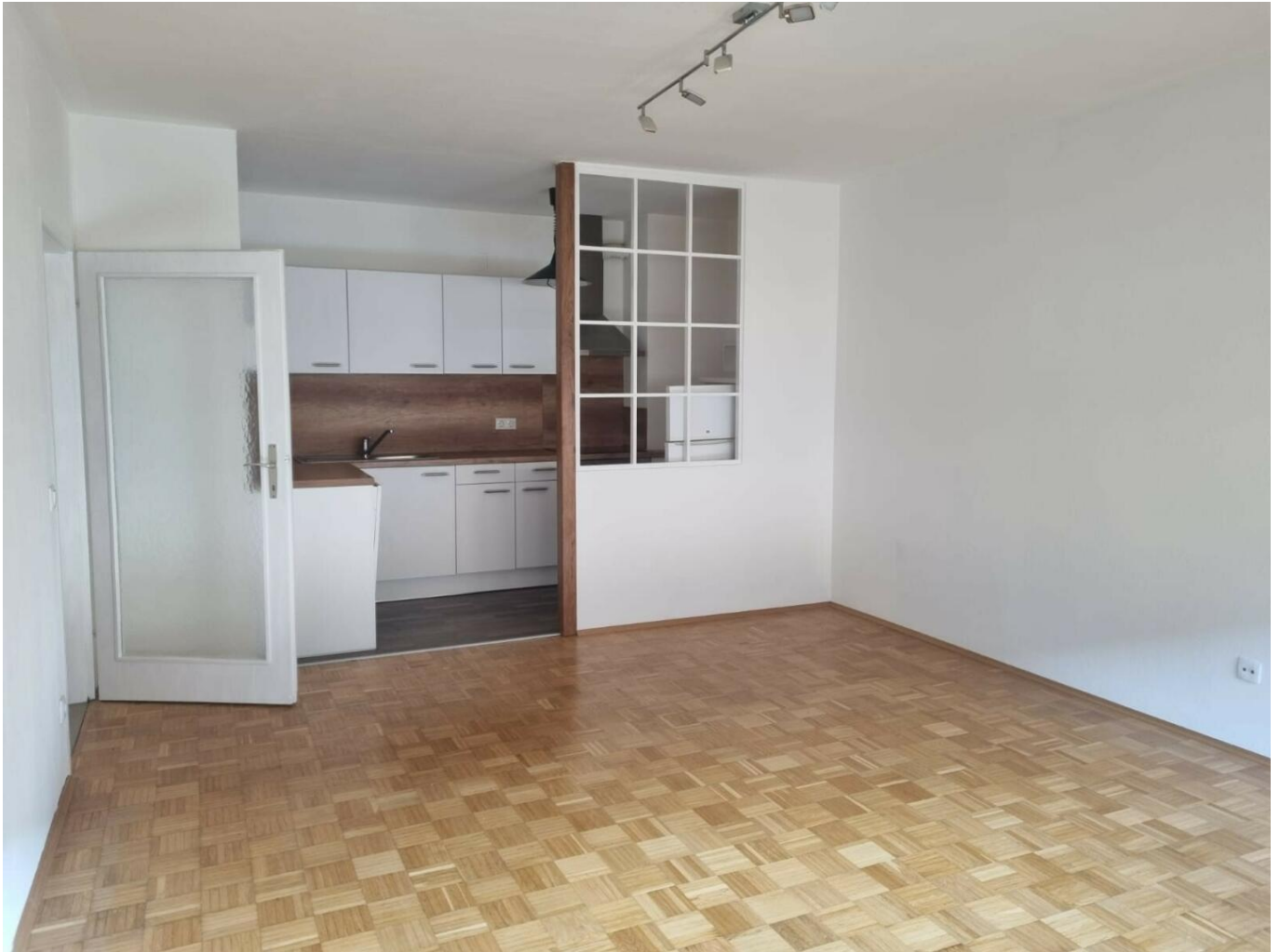
Wohnzimmer mit offener Küche