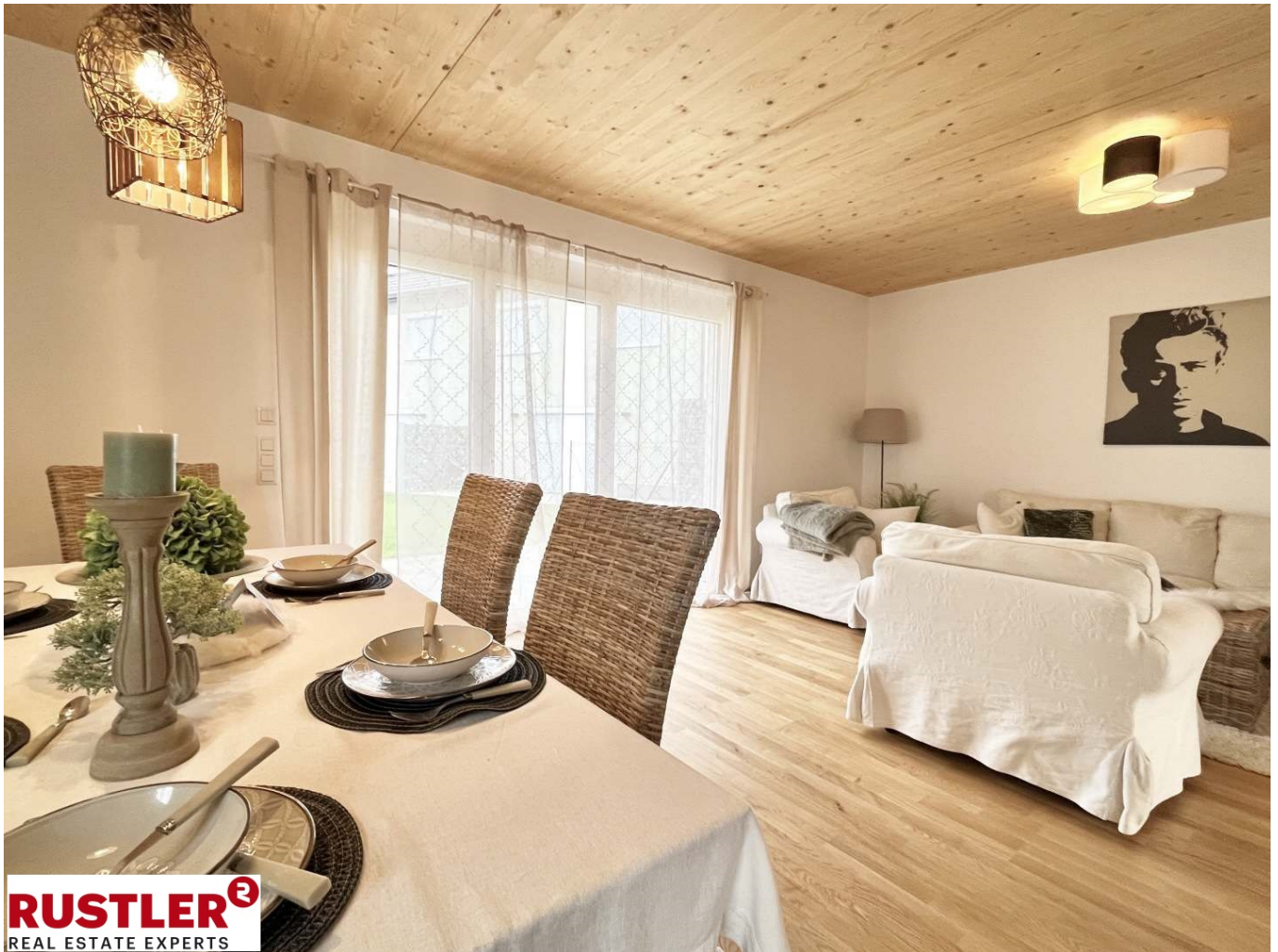
Wohnküche A I