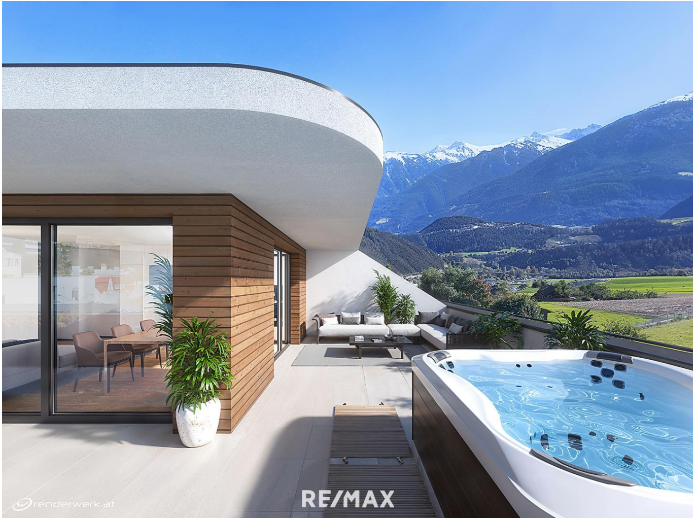
Wohnung - Terrasse