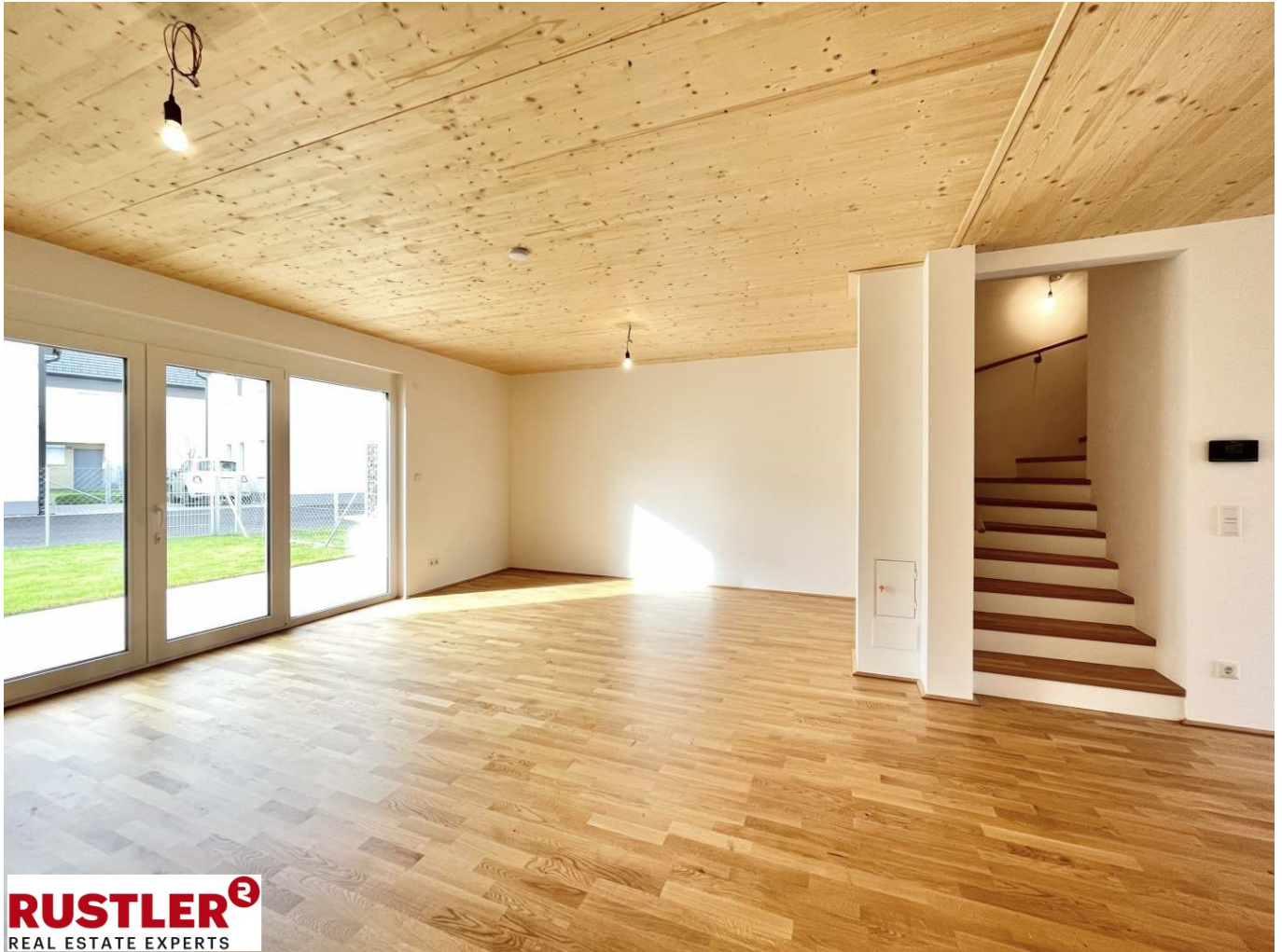
Wohnraum mit Treppen