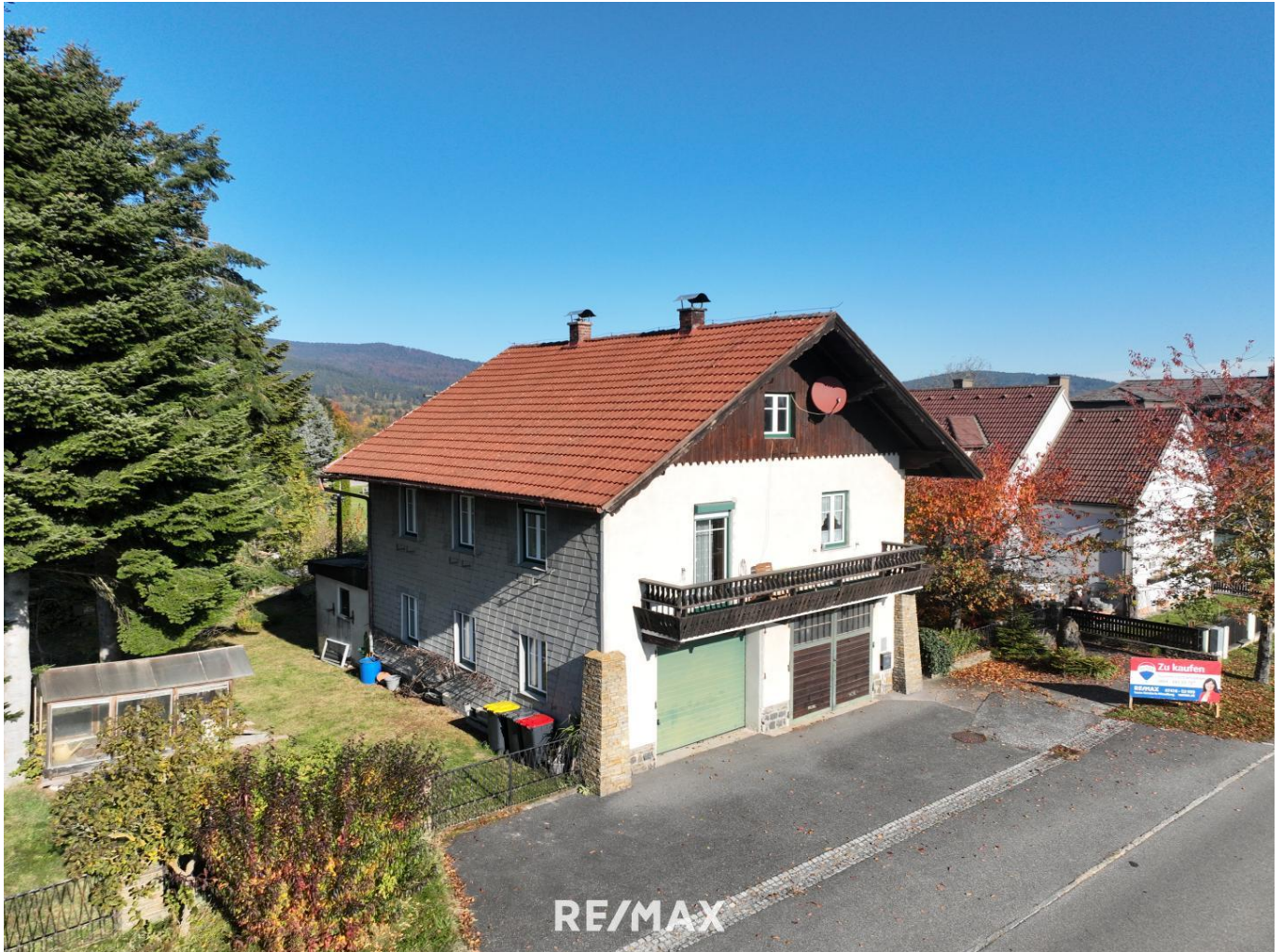
Haus mit Garagen und Garten