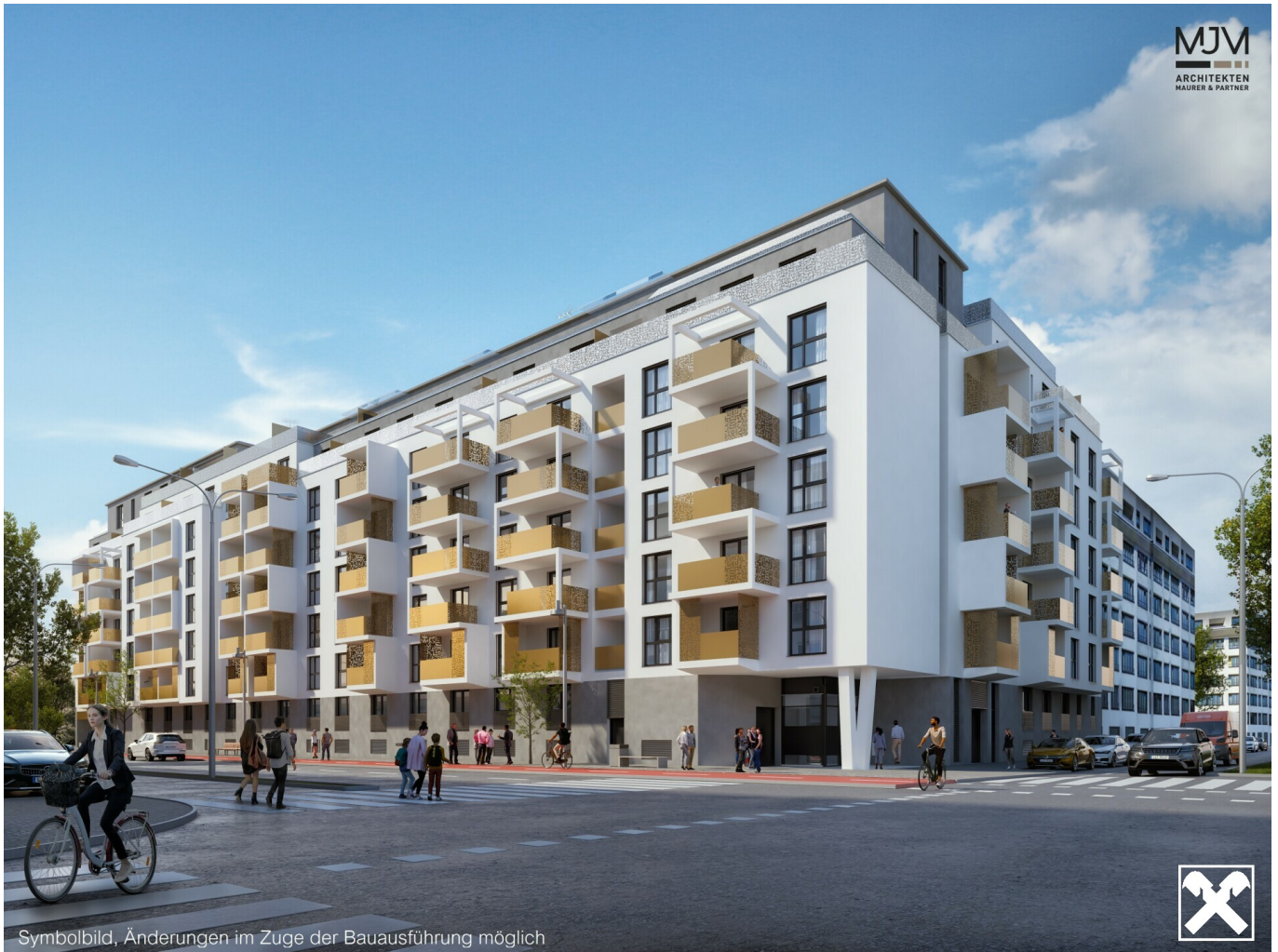
Arakawastrasse - visualisiertes Symbolbild