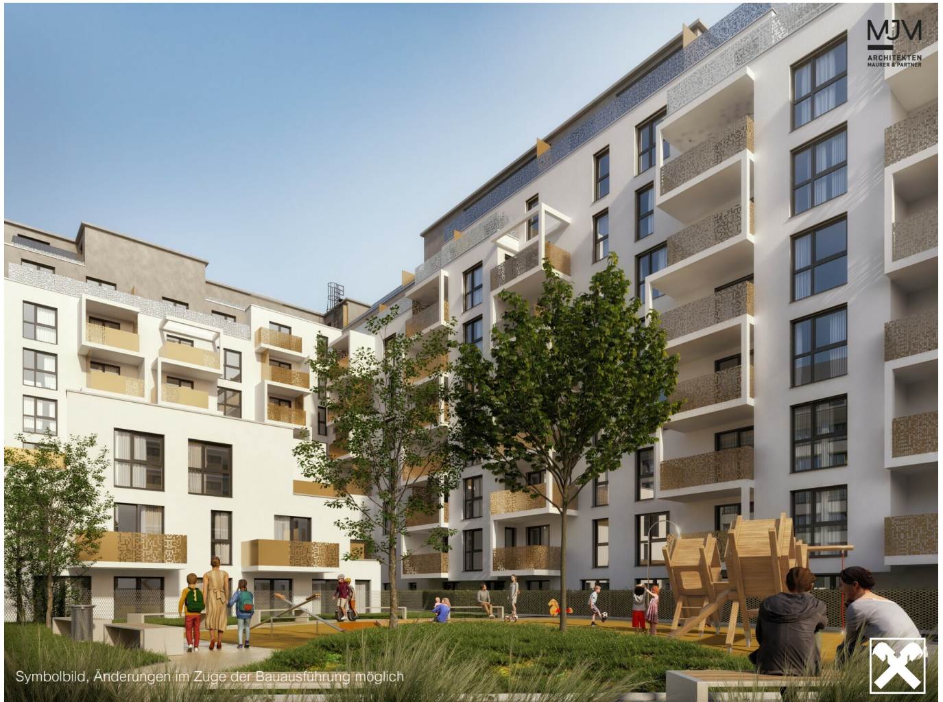
Hofansicht - visualisiertes Symbolbild