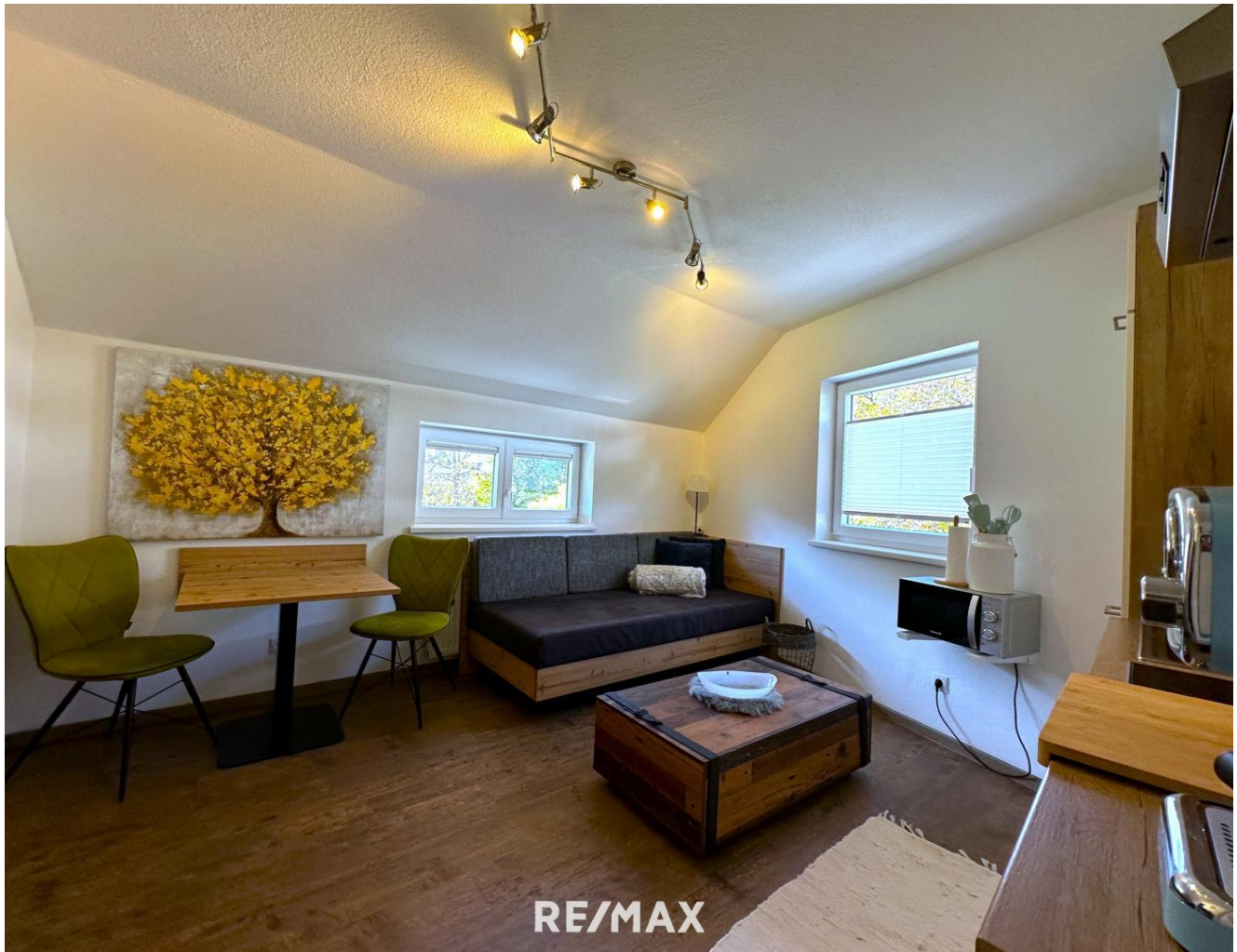
Wohnung - Wohn-, Koch- und Essbereich