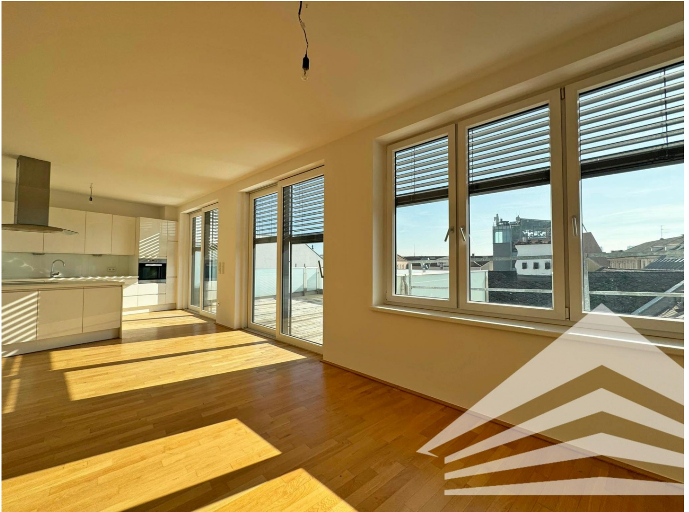
Küche | Wohnzimmer