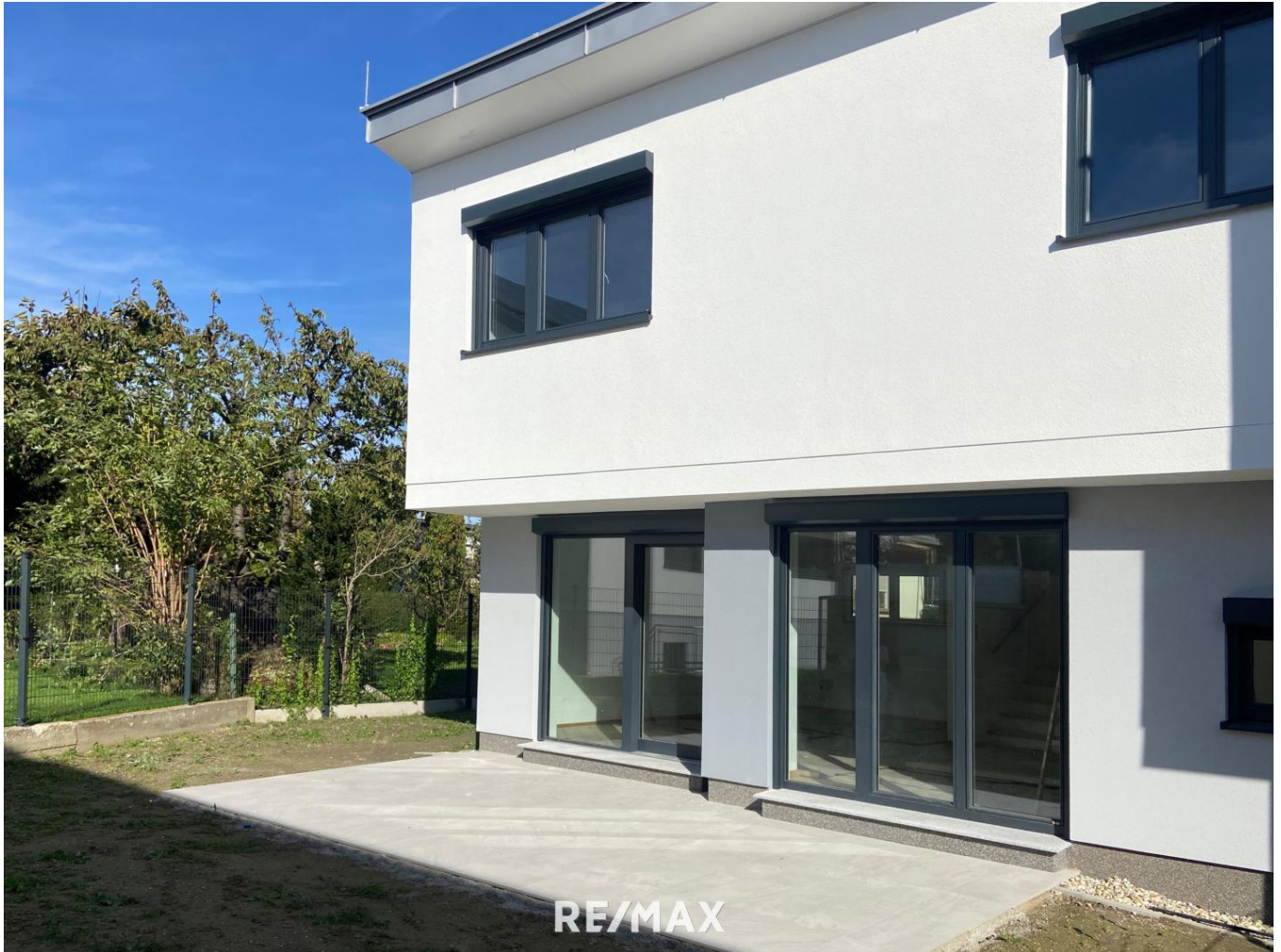
Terrasse mit Zugang zum Wohnzimmer