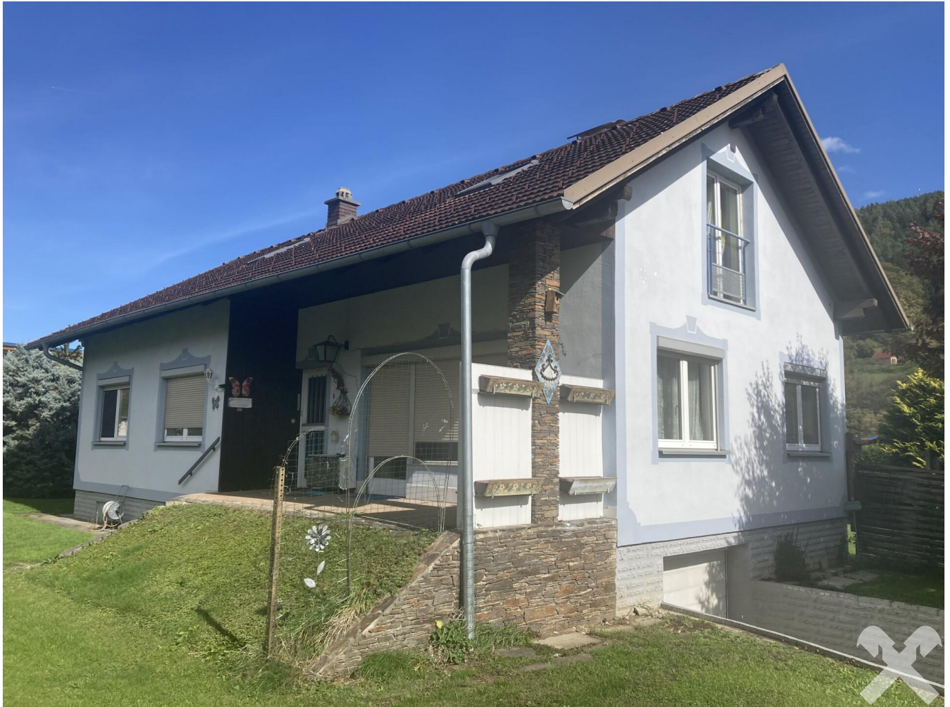
Südansicht mit Einfahrt Garage