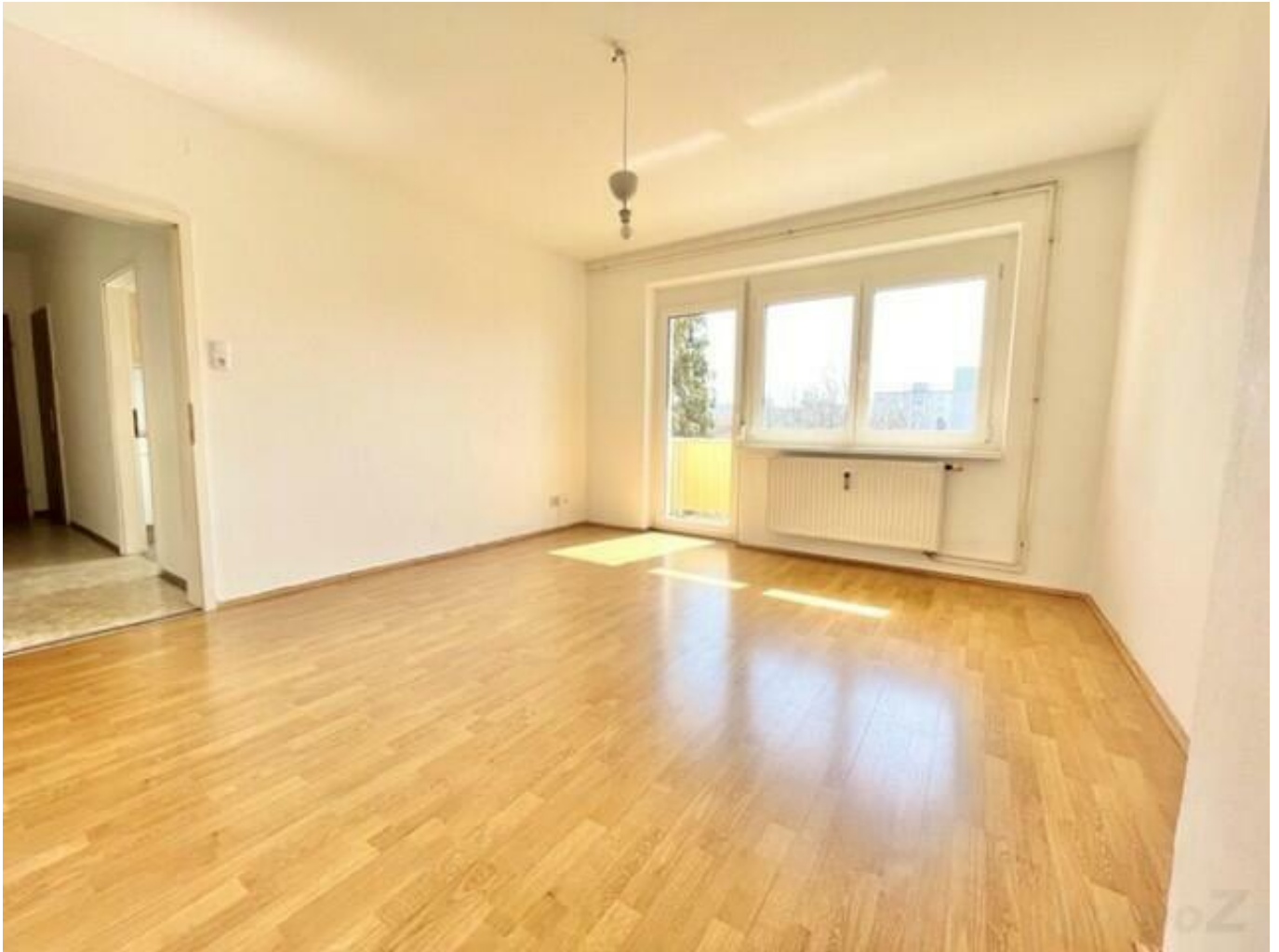
Wohn-Schlafzimmer mit Ausgang zum Balkon

vermietet bis 7/2028, gepflegte Großgarconniere mit Wohnküche und Süd - Balkon- 3.Stock ohne Lift.