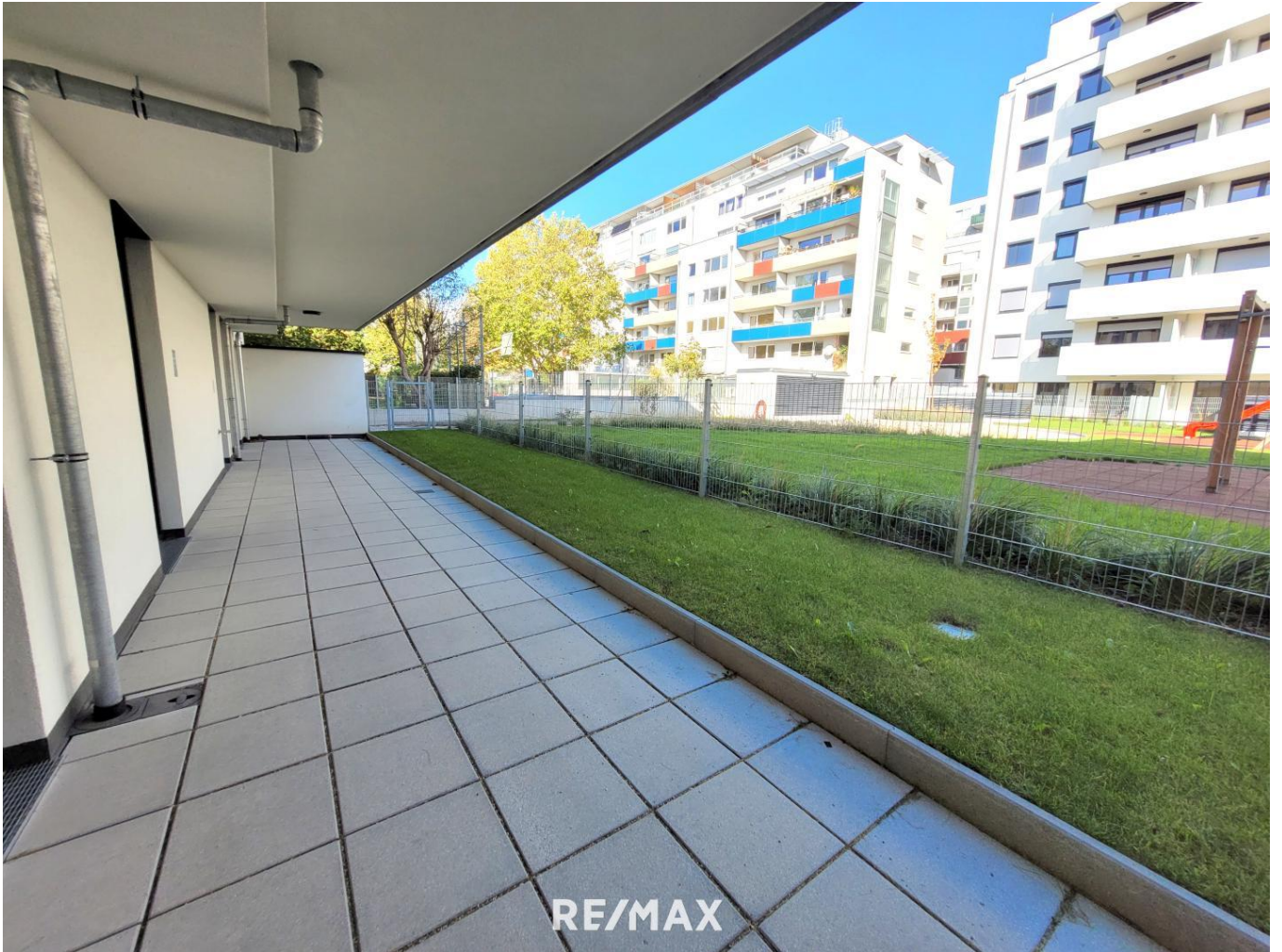
Terrasse und Garten

Objektnummer: 1609_42286 Eine Immobilie von RE/MAX First