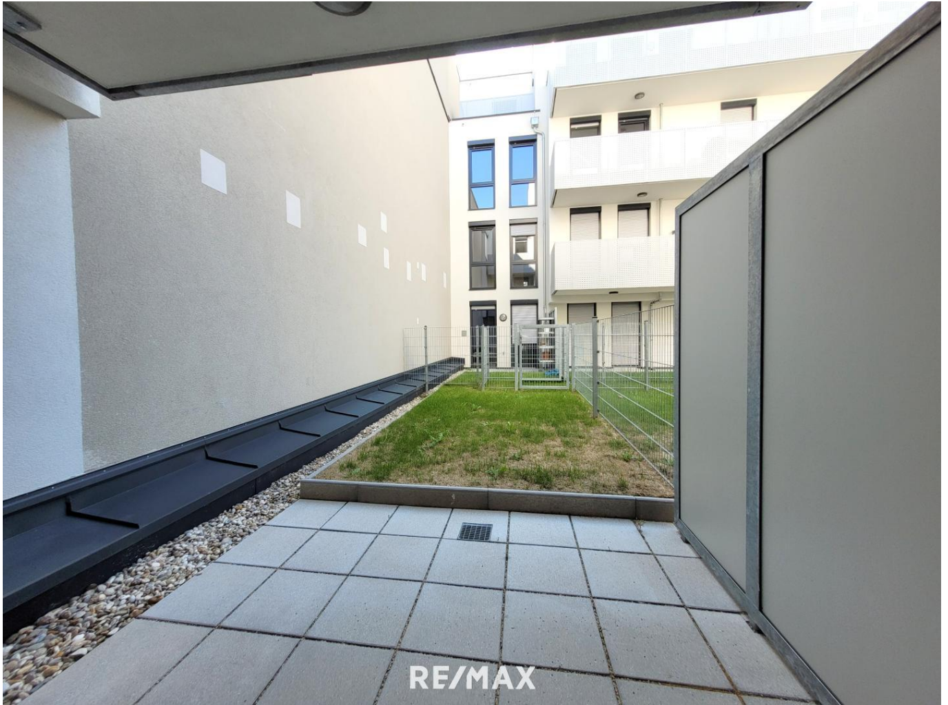
Wohnzimmerterrasse und Garten