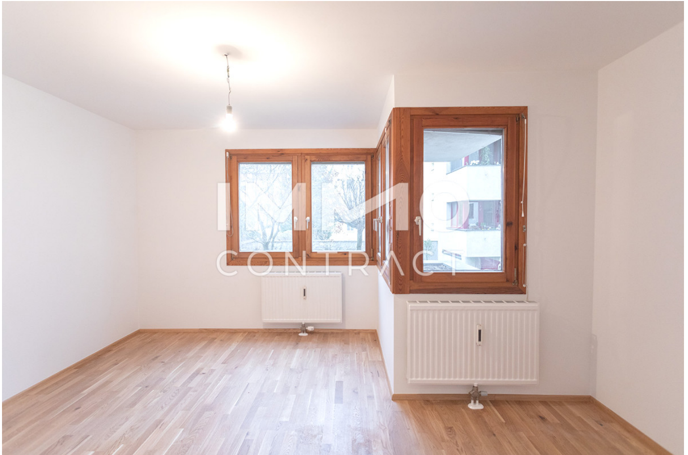
Zimmer 1 mit Blumenbeet vor dem Fenster