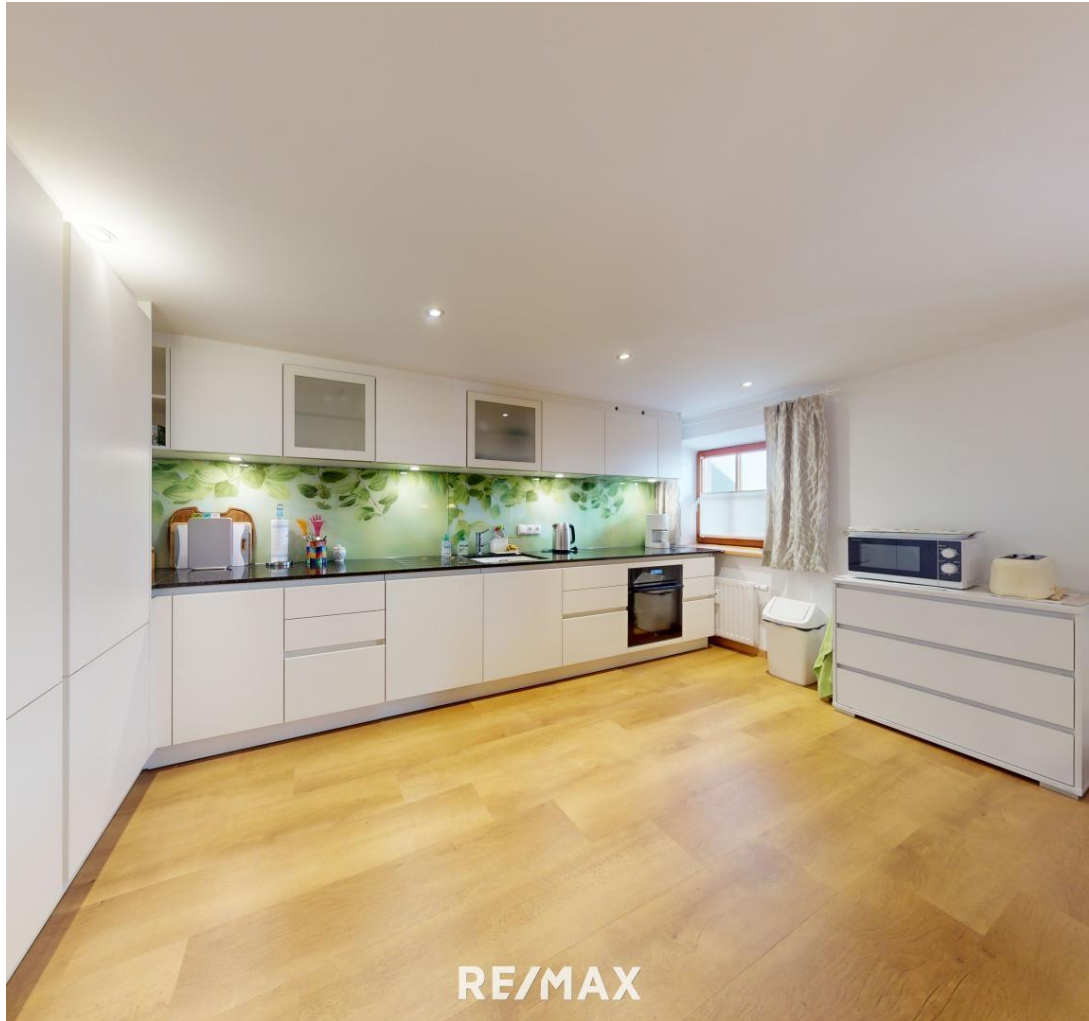
Wohnung - Küche