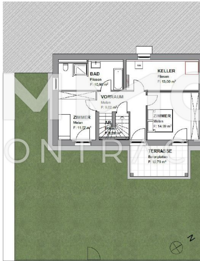
Lageplan | Gesamtansicht Anlage