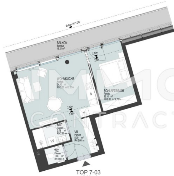
TOP 7-03 47,33 m 2