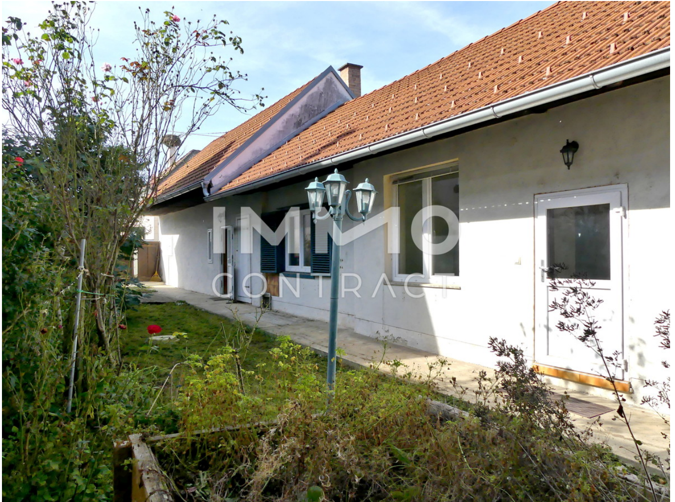
Hinterer Teil des Streckhofes mit zweitem Eingang beim Heizraum