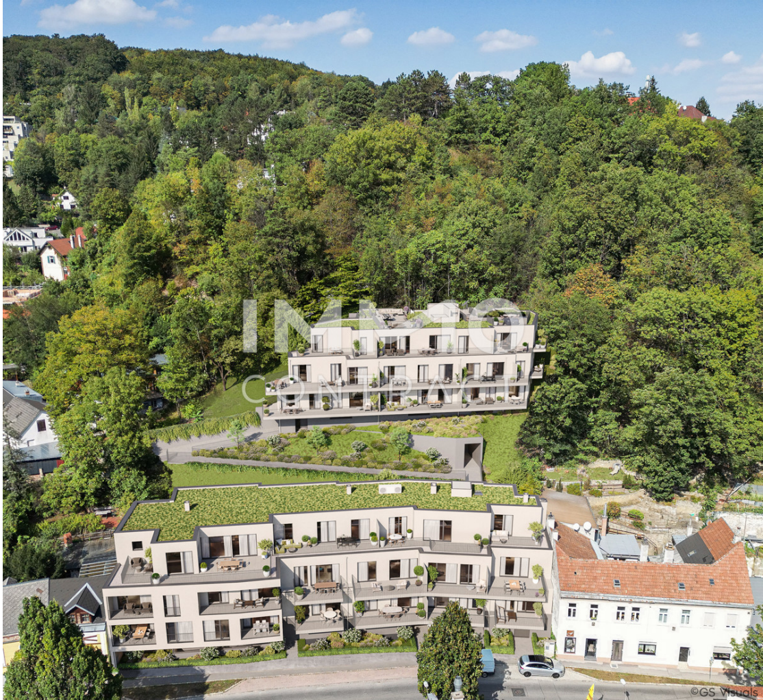
Cam 3_Kaltenleutgeben_Variante 1