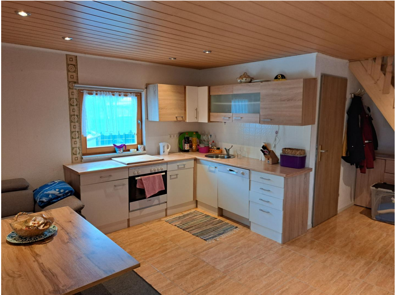
Wohnen - Kochen

machen Sie ihr Angebot!!! Gartenhaus + Pool + Grillplatz + Garten Bj 2016