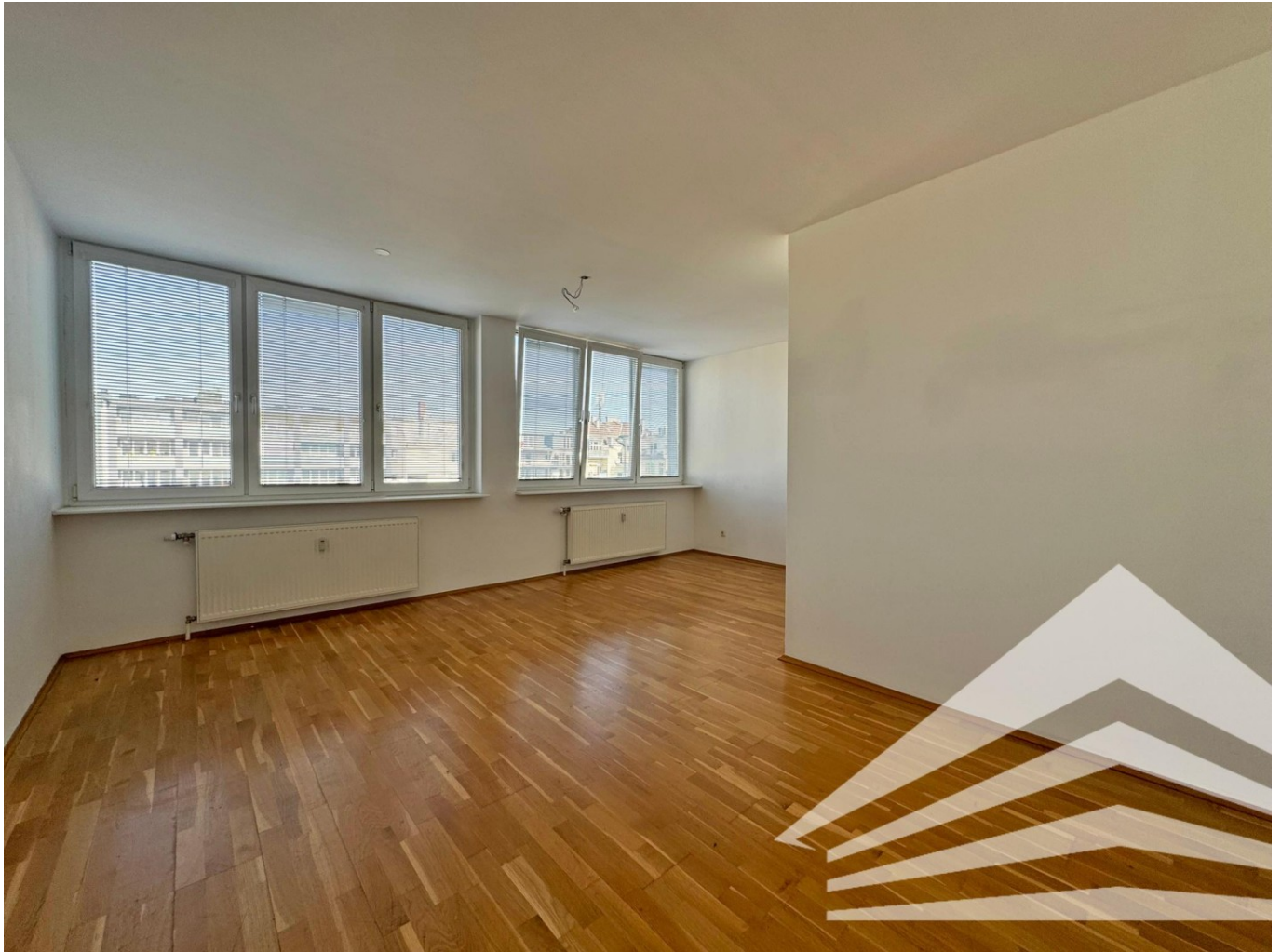
Wohn- und Schlafzimmer