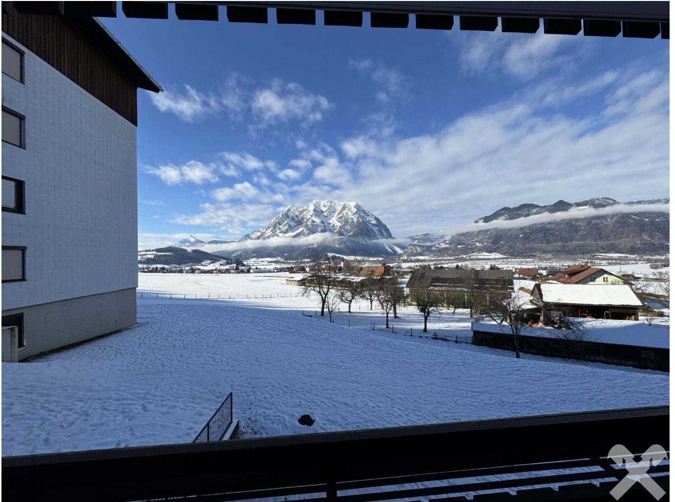
Ausblick auf den Grimming