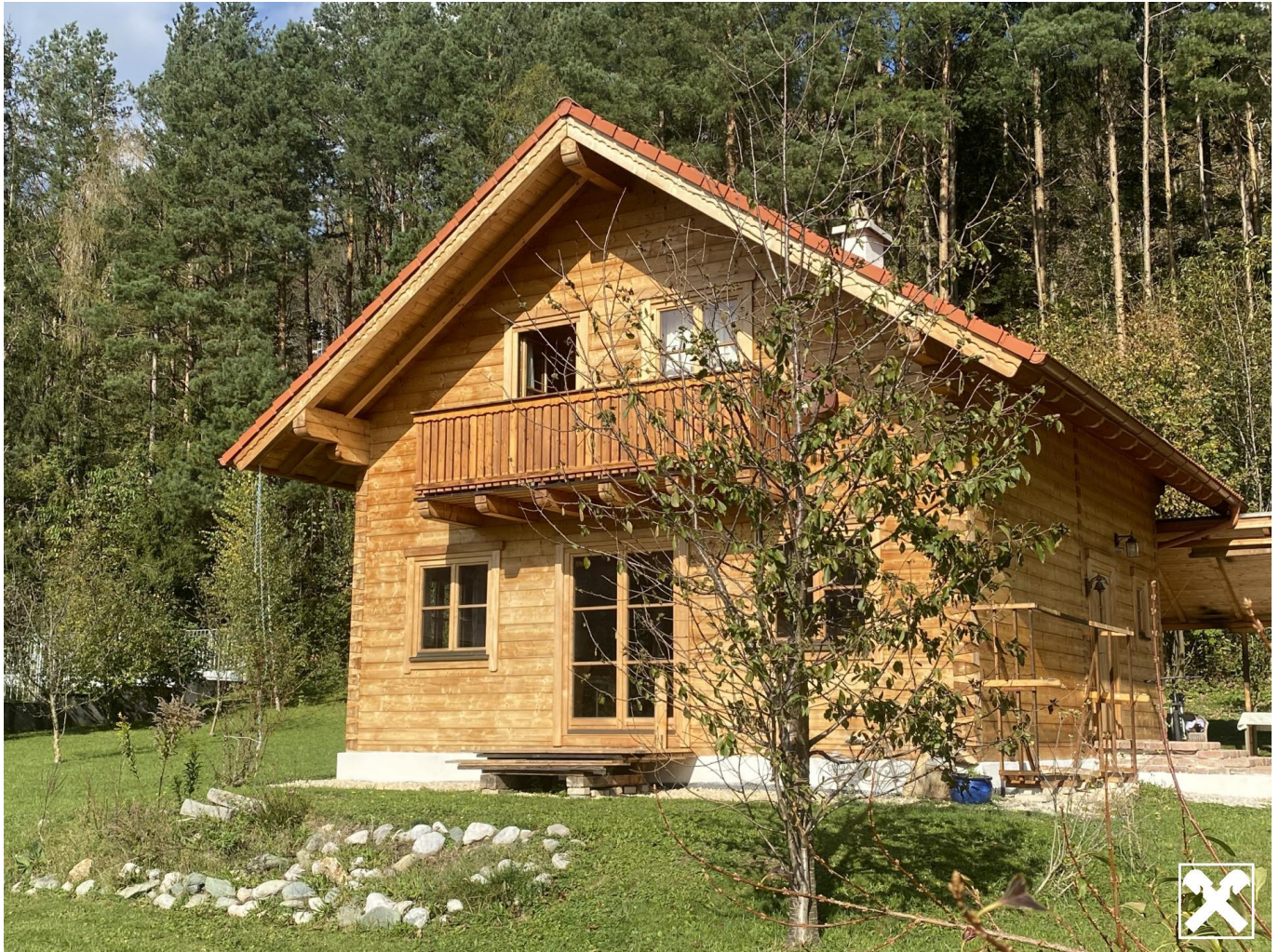
Südseite und Eingangsansicht