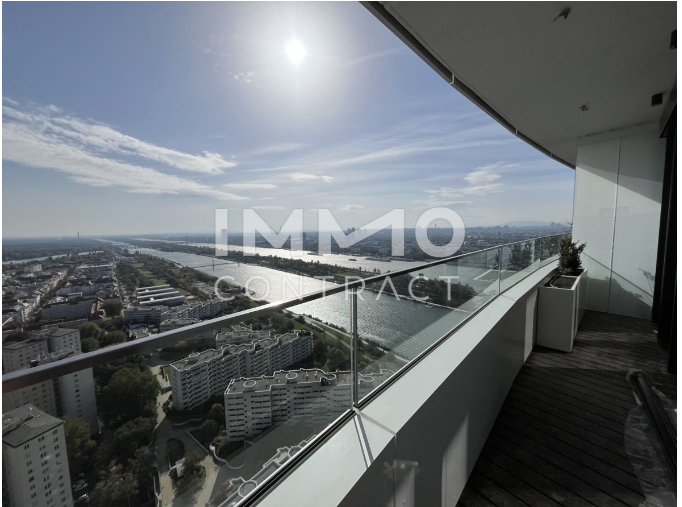
Ausblick Richtung Neue Donau