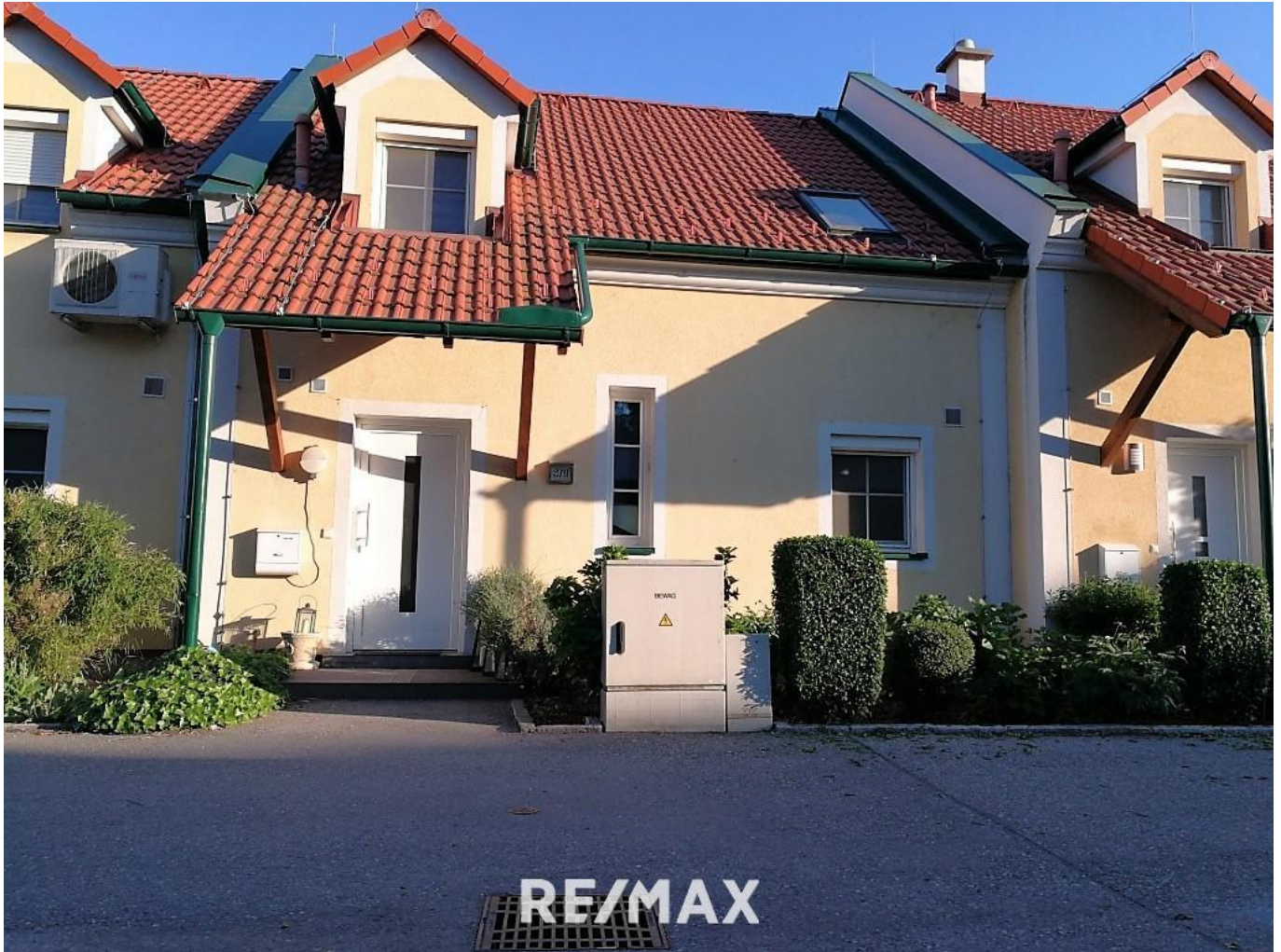
1. Jois-Haus mit Ausblick